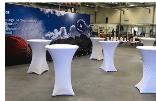
Förberedelser inför Prevas årsstämma den 14 maj 2019. Stämman hölls i Prevas automationsverkstad i Västerås.